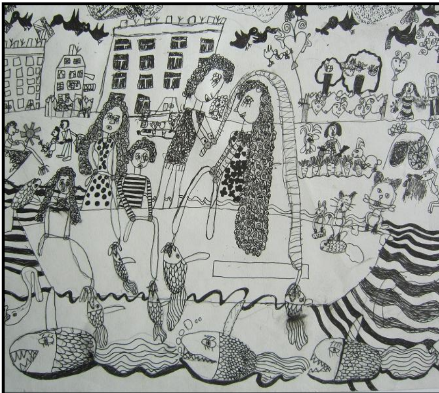
Lia Rabinova, 7 let, Dětskaja škola, Zaslavl, Bělorusko - Belarus