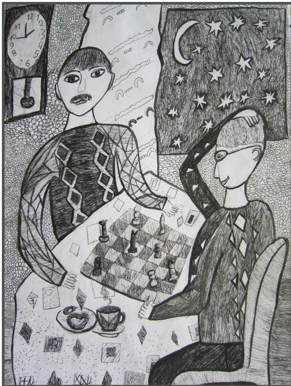
Denis Filipčik, 10 let, kresba, Dětškaja škola, Zaslavl, Bělorusko - Belarus