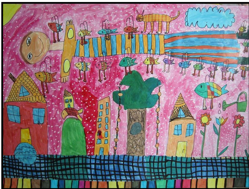
Kacper Kwasniewski, 7 let, kresba, malba „Jednou ryby budou umět létat a tehdy poletím s nimi“ MDK Kielce, Polsko - Poland

Town Library on Šrámkova Street in Havířov