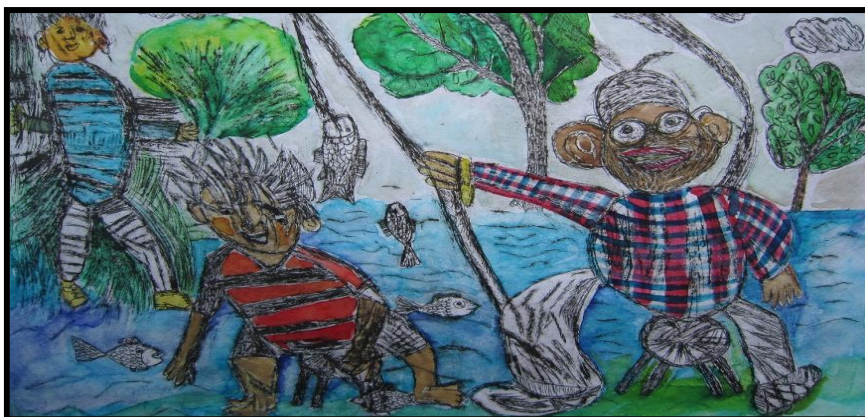
„S dědečkem na rybách“, kolorovaná suchá jehla Lucie Surá, 20 let, ZŠ a MŠ, Turkmenská, Vsetín, ČR - Czech Republic

Karu Kristin Pelgulinna Gümnaasium, Tallinn Tonts